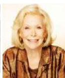
Louise L. Hay