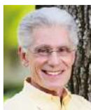
Dr. Brian Weiss