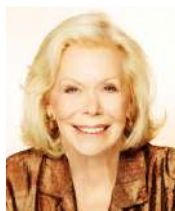
Louise L. Hay