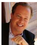
Dr. Joe Dispenza

e scarica subito GRATIS l'eBook Top Ten contenente 256 pagine tratte dai Best Seller degli autori più amati