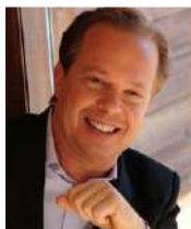
Dr. Joe Dispenza